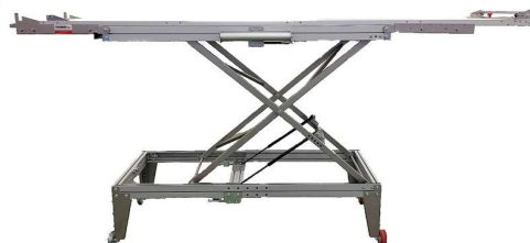
パンタグラフタイプ