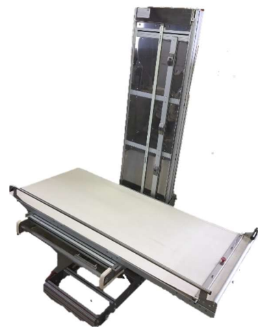
シングルポストタイプ